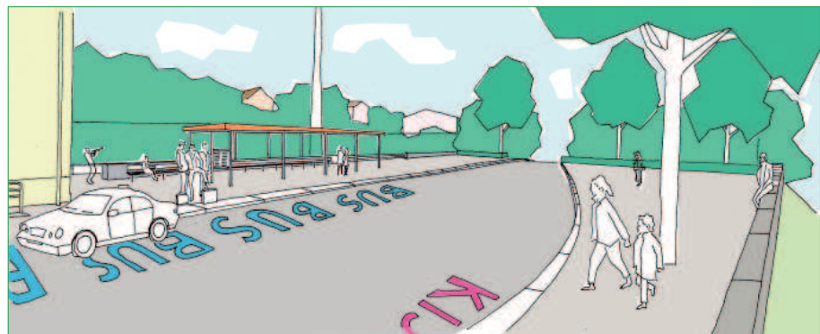
Ansicht Bahnhofsvorplatz II

Künftig werden die Busse nahe des Bahnsteiges und der geplanten Tunnelrampe halten. Die Vorplatzgestaltung organisiert nicht nur die Wege- und Umsteigebeziehungen neu. Sie stellt auch den Blickkontakt zum bisher nicht erkennbaren, sehenswerten Stadtkern her. Zur Bearbeitung der Aufgabe war die Koordination und Integration mehrerer Fachingenieurleistungen erforderlich.